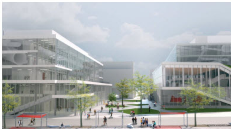
Menkès Shoener Dagenais Letourneux Architectes